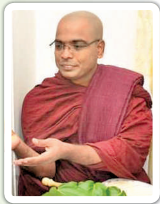
රත්නපුර, පැල්වැටිය මිණිපුර අමා ශාන්ති තපෝවනය තපෝවනයේ රතන හිමි

අතීතයේ විවිධ භවවල දී මහ බෝධි සත්වයන් වහන්සේන් සමඟ දැඩි කලකුණ මිත්‍රත්වයෙන් ආ කන්ටක අශ්වයා මහ බෝසතුන් සමඟ එකම දිනයේ දී උපත ලැබී ය. බෝසතුන් අභිනිෂ්ඨමණය කළ දින වෙන්ව යන්නට සූදානම් වන විට, ඒ විටේ දුක ඉවසා ගැනීමට නොහැකිව කන්ටකට ධරපතළ දරුණු මාරාන්තික ආබාධයක්