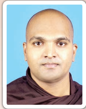
දඹාන මාවරගල ආරණ්‍ය සේනාසනවාසී ආචාර්ය

රහත් වහන්සේ වැඩියෙන් ම වැඩ සිටි යුගයක් නම්යි අනුරාධපුර යුගය කියන්නේ. මේ කාලයේ ශ්‍රී ලංකාවේ ගොඩාක් ප්‍රසිද්ධියට පත් වූ ජනපදයක් තිබුණා. සුරථිධි ජනපදය කියලා.