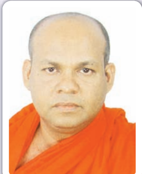
මහව, උඩගම ශ්‍රී ඉන්ද්‍රසුමන මහ පිරිවෙන්හි ප්‍රවීණාචාර්ය, ප්‍රචචන කීර්ති ශ්‍රී ලේඛන ශාස්ත්‍රී

උසස් මනසක් ඇති සෑම දෙනෙක් විසින් ම උතුම් ශ්‍රී සද්ධර්මය අනුගමනය කිරීම හා ප්‍රායෝගික ජීවිතය තුළ එය ක්‍රියාත්මක කිරීම ප්‍රඥාගෝචර ය. එසේ කිරීම මෙලොව පරලොව දුක් දුරු කර නිවන් පිණිස හේතු වේ. ඉහත කරුණු සැලකිල්ලට ගෙන දුර්ලභව ලද මිනිසක් බව ගුණධර්ම තුළින් පෝෂණය කොට ගෙන ගෙවන කෙටි කාලය තුළ යුතුකම් හා වගකීම් ඉටු කරමින් මිනිසක් බව අර්ථවත් වන අයුරින් ජීවත් වීම ඉතා වැදගත් වේ.