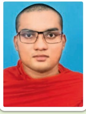
ජේරාදෙණිය විශ්වවිද්‍යාලයේ රාජකීය පණ්ඩිත

“අපි සෑම දිශාවෙන් ම දසුන් ගෝත්‍රිකයන් විසින් වට කරනු ලැබ සිටිමු. ඔවුහු පුද පූජා නො පවත්වති. කිසිවක් ගැන විශ්වාස නොකරති. ඔවුහු මනුෂ්‍යයෝ නොවෙති. සතුරන් නසන්නා සේ ඔවුන් මරා දමන්න. දාස වර්ගයා විනාශ කරන්න.” යනුවෙන් මේ දෙපිරිස අතර පැවති සංස්කෘතිකමය වෙනස ද පිළිබිඹු වෙයි. මෙකී විෂමතාවන්ගේ