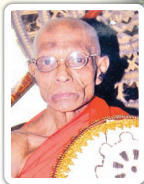
අස්ගිරි මහා විහාර පාර්ශ්වයේ උපාධ්‍යාය

යෙකෙහි බුද්ධිං සරණං ගතාසෙ නතෙ ගමිස්සන්ති අපායං පහාය මානුසං දෙනං දෙව කායා පරිපුරෙස්සන්ති