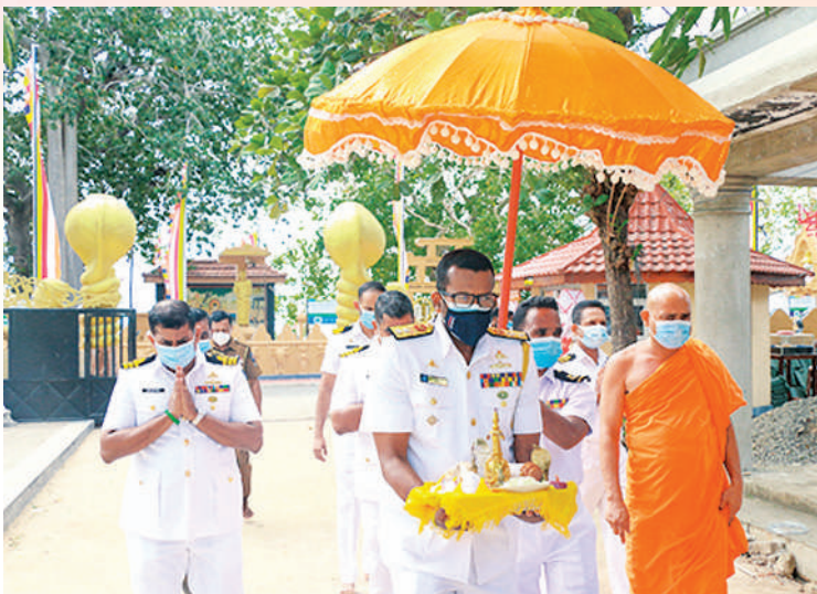
නිධන් වස්තු වැඩම කරවූ අවස්ථාව