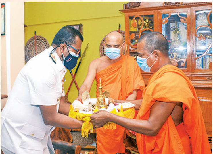
පදමකිත්ති හිස්ස නාහිමියන් සහ අරියකිත්ති හිමියන් විසින් ආඥාපති රියර් අද්මිරාල් ප්‍රියන්ත පෙරේරා මහතාට නිධන් වස්තු ලබා දුන් අවස්ථාව

රියර් අද්මිරාල් ප්‍රියන්ත පෙරේරා මහතාගේ ප්‍රධානත්වයෙනි. නවදගල පදමකිත්ති හිස්ස නාහිමියන්ගේ අනුශාසනා පරිදි නාවික හමුදා නිර්මාණ ශිල්පීන්ගේ දායකත්වයෙන් නාගදීප පුරාණ රජමහා විහාරයේ අභිනව පිරිනිවන් මංචකයේ සැතපෙන බුද්ධ ප්‍රතිමා වහන්සේ නිර්මාණ කටයුතු සිදු කෙරේ. නිධන් වස්තු තැන්පත් කිරීම පදමකිත්ති හිමියන්ගේ සුරතින් හා රියර් අද්මිරාල් ප්‍රියන්ත පෙරේරා මහතාගේ සහභාගිත්වයෙන් සිදු කෙරිණි. ඒ සියලුම නිධන් වස්තු පදමකිත්ති හිමියන් විසින්ම සපයා ගන්නා ලදී. මේ පිරිනිවන් මංචකය උතුරේ